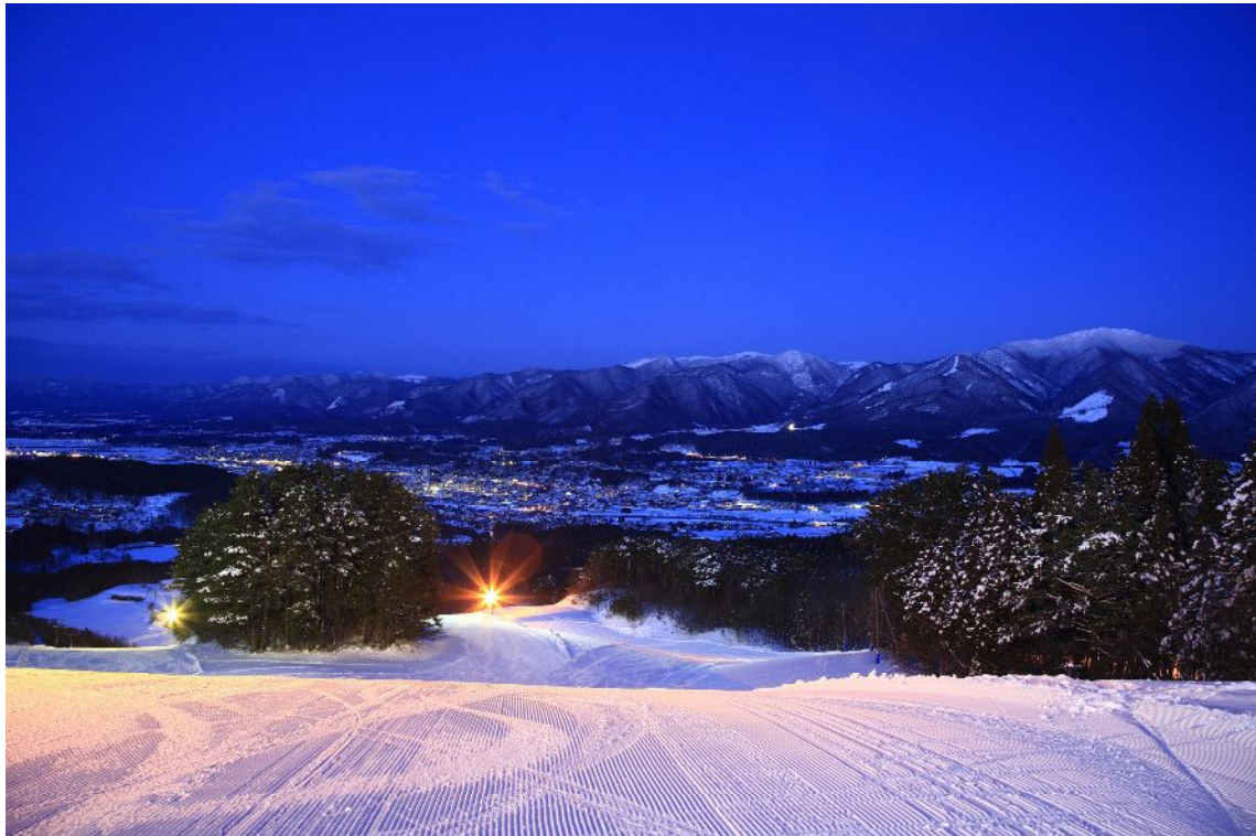
(山頂より鹿角市街地の夜景)